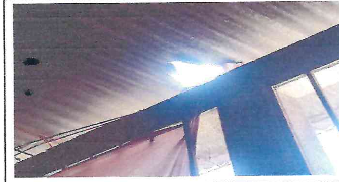
fot 4. Agüero grande